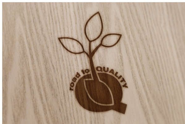
TAVOLA 12 | ESEMPI DI UTILIZZO