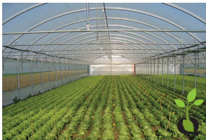
TAVOLA 10.a | MODALITÀ DI UTILIZZO DEL LOGO SU BOX FOTO E/O GRAFICI